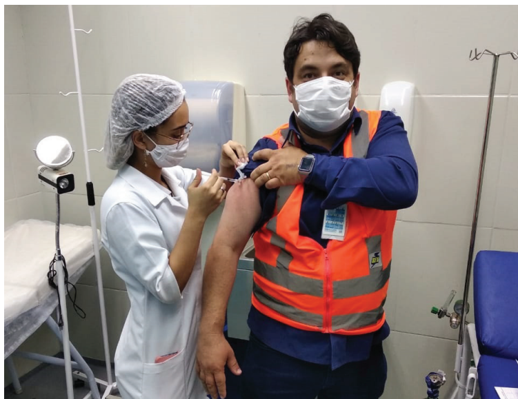
Campanha de vacinação contra o Sarampo realizada na Mineração Morro do Ipê facilitou a imunização de dezenas de pessoas.